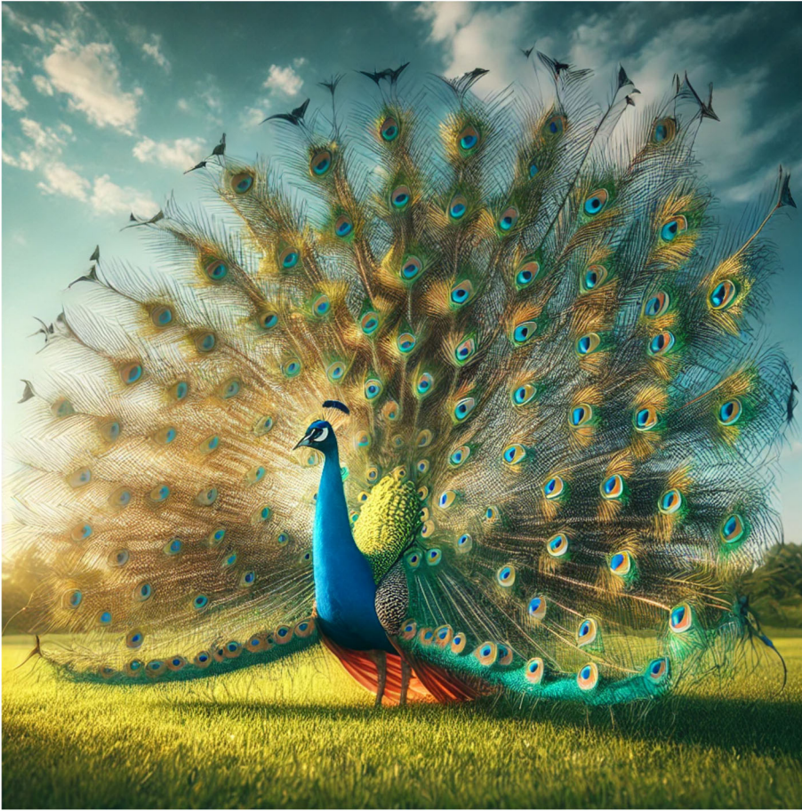
Un paon "revisit  " par l'intelligence artificielle, presque aussi beau que celui que nous avons vu !