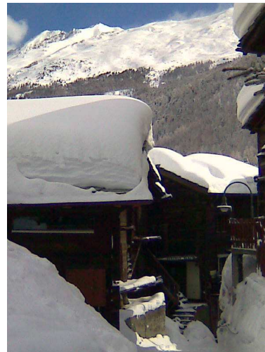
7 mars 2009

Cette année encore, quelques membres de notre club, ainsi que des amis et des proches se sont retrouvés à 18h00 le samedi 28.02.2009 au buffet de la gare de Zermatt pour l'apéritif de bienvenue à cette semaine de ski. Nous pouvons dire que ce séjour, qui se répète depuis plus de 15 ans à la même époque, est entré un peu dans les classiques du Glacier pour ceux qui y participent, bien que ne figurant pas au programme des courses.