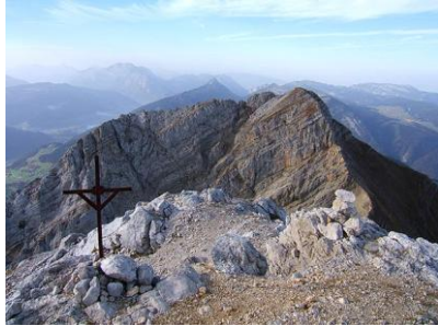
Le Jalouvre vu de la Pointe

Du col de la Colombière, on suit la sente qui mène au départ de la via ferrata. On gravit celle-ci puis lors de la descente on monte les pentes herbeuses qui mènent à l'arête Sud du Jallouvre. On suit cette arête (quelques pas d'escalade facile) pour gagner le point culminant. La descente se fait par la voie normale qui passe par le Col du Rasoir.