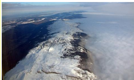
La chaîne du Jura